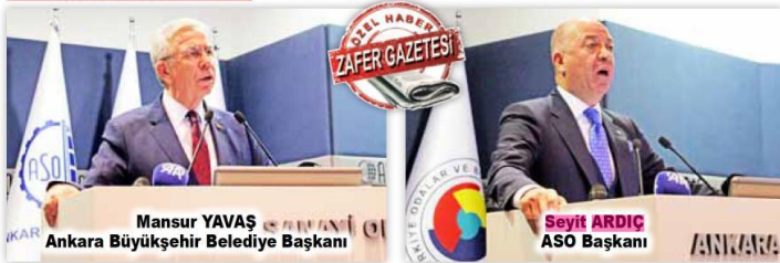
Mansur YAVAŞ Ankara Büyükşehir Belediye Başkanı

Metro hakkında da konuşan Yavaş, şu ifadeleri kullandı: "Metro konusuna gelince, başkanlık dönemimizde Keçiören'den havaalanına metro projesine başladık. Ancak ihalede yüksek teklifler alınca, şu anda daha fazla katılımcıyla yeniden ihale yapmayı düşünüyoruz. Çayyolu Metrosu'nun parasını alamadık ve Ulaştırma Bakanlığı'na yazı yazarak durumu ilettik. Metro projelerinin projesi tamamlandı ve ihale için hazırız. Fuar alanı konusunda ise müteahhitlerle yaşanan sorunları mahkemeye taşıdık, davayı kazandık. Ancak yönetim kurulu üyelerinden bazıları metro istemiyor, bu konuda kararsızlar. Fuar alanının ekonomik değeri olduğuna inanıyorum, ancak gelecek dönemde ne yapılacağını yönetim kurulu belirleyecek."