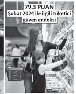
79.3 PUAN Şubat 2024 ile ilgili tüketici güven endeksi